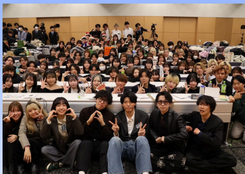
クリスマスパーティー全体写真