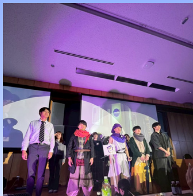
演技・勇者アキムネとその仲間たち